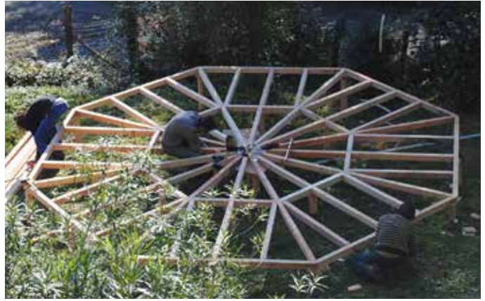
Plancher en étoile