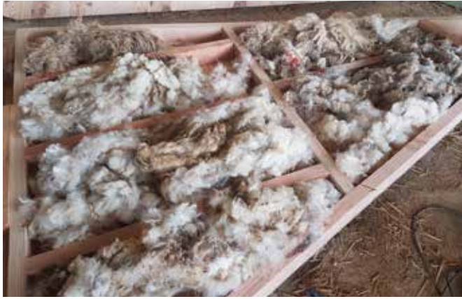
Isolation en laine de mouton brut