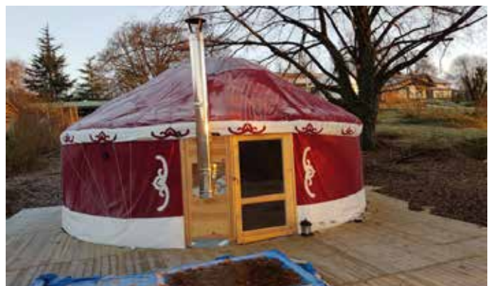
Sortie de poêle