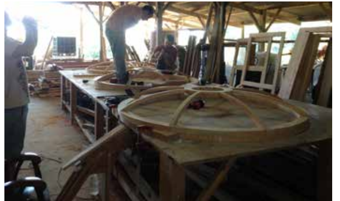
enfilade de toono