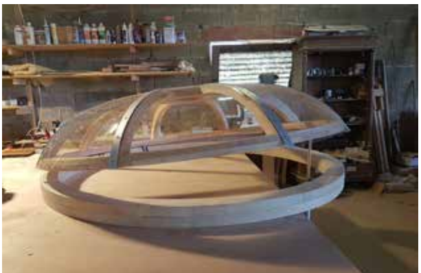
toono ouvrant en Altuglass 2mm