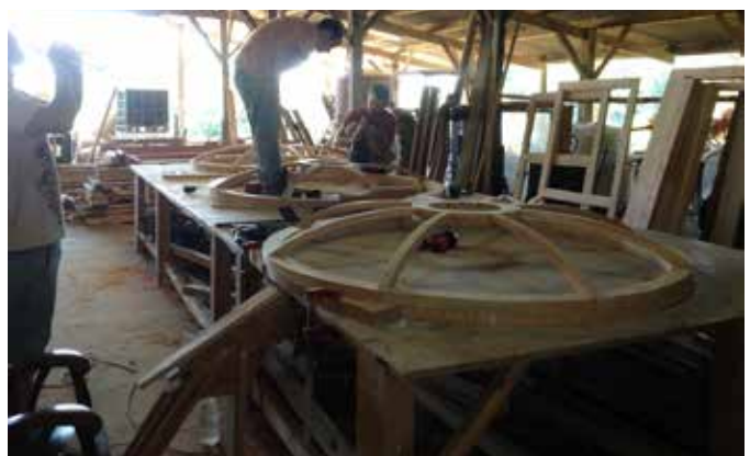
enfilade de toono